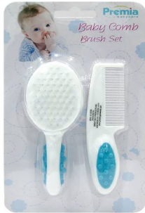
CEPILLO CAPILAR P/BEBE PREMIA SET 2PZA