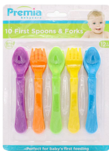
CUBIERTOS P/BEBE PREMIA BABY 10PZA