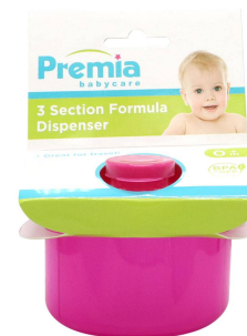
DISPENSADOR D/LECHE PREMIA BABY