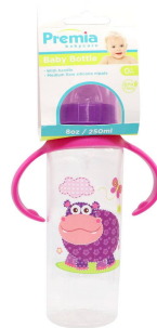
BIBERON PREMIA BABY 8OZ 20287