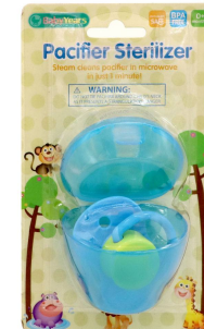
CHUPON P/BEBE PREMIA BABY