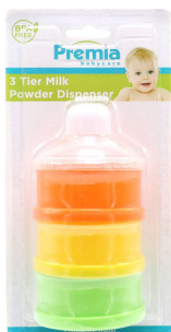
DISPENSADOR D/LECHE PREMIA BABY