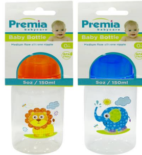
BIBERON PREMIA BABY 5OZ 20273