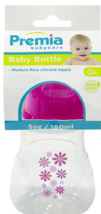
BIBERON PREMIA BABY 5OZ 20317