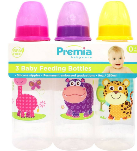
BIBERON PREMIA 9OZ 3PZA