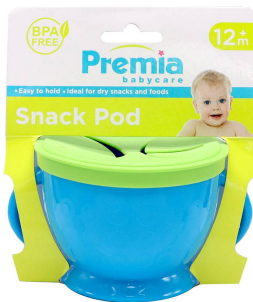
VASIJA P/BEBE PREMIA BABY