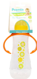
BIBERON PREMIA BABY 8OZ 20315