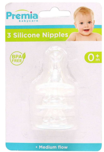
CHUPON P/BIBERON PREMIA BABY 3PZA