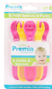
CUBIERTOS P/BEBE PREMIA BABY 6PZA