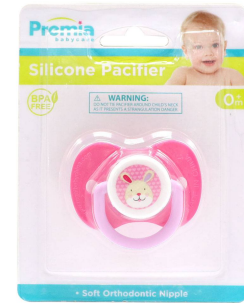
CHUPON P/BEBE PREMIA BABY