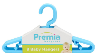
PERCHAS PREMIA BABY 8PZA