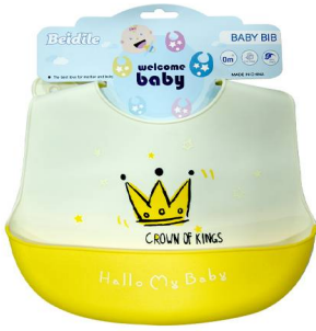
BABERO BEIDILE C/BOLSILLO SILICONE BDL3063