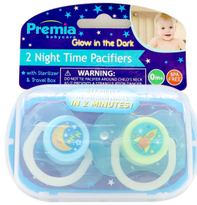
CHUPON P/BEBE PREMIA BABY 2PZA