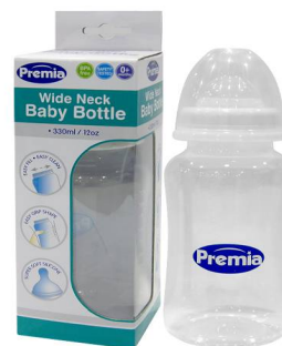
BIBERON PREMIA BABY 12OZ