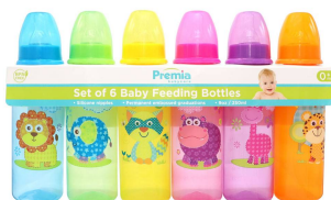
BIBERON PREMIA BABY 9OZ 6PZA