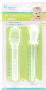
SET P/BEBE PREMIA CUIDADO PERSONAL 2PZA