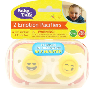
CHUPON P/BEBE PREMIA BABY 2PZA