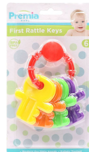
JUGUETE P/BEBES PREMIA BABY 20599