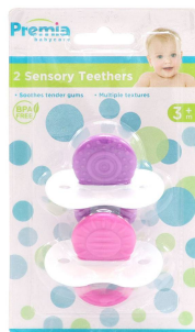
MORDEDOR P/BEBE PREMIA BABY 2PZA