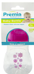
BIBERON PREMIA BABY 5OZ 20317