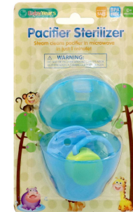
CHUPON P/BEBE PREMIA BABY