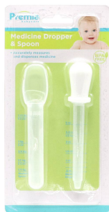
SET P/BEBE PREMIA CUIDADO PERSONAL 2PZA