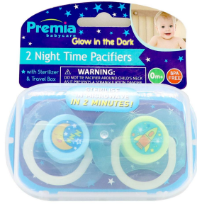
CHUPON P/BEBE PREMIA BABY 2PZA