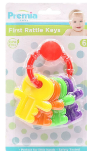
JUGUETE P/BEBES PREMIA BABY 20599